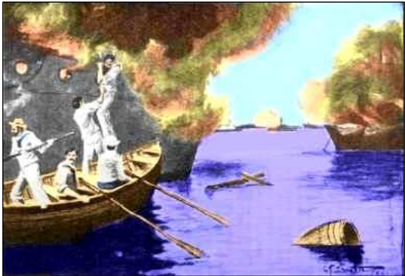
Franz Itrich w czasie akcji w Zatoce Manilskiej

Po wojnie, dzięki rekomendacji kapitana USS „Petrel”, Itrich został awansowany do stopnia podoficera otrzymując funkcję tzw. „głównego cieśli okrętowego” ( Chief Carpenter's Mate ). Potem zaś - 5 grudnia 1900 roku został odznaczony amerykańskim „medalem honoru” ( Medal of Honor ) – najwyższym odznaczeniem