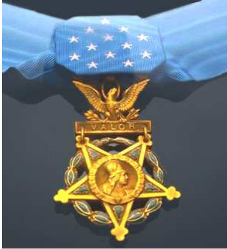
„Medal of Honor”