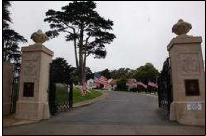
„San Francisco National Cmentary”